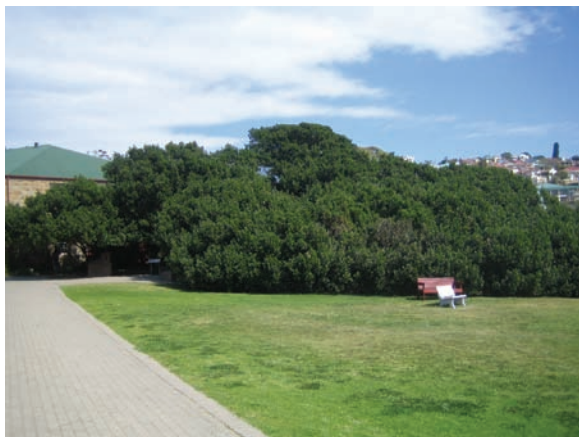
The Post Office Tree ( Sideroxylon inerme ) in Mossel Bay, South Africa, in 2009.

sailor, Pedro de Ataíde, dated from 1501 reputedly in a shoe hanging from what became known as the Post Office Tree ( Sideroxylon inerme L.) in Mossel Bay, South Africa (Esterhuyse et al. 2001; Lehmkuhl 2008).