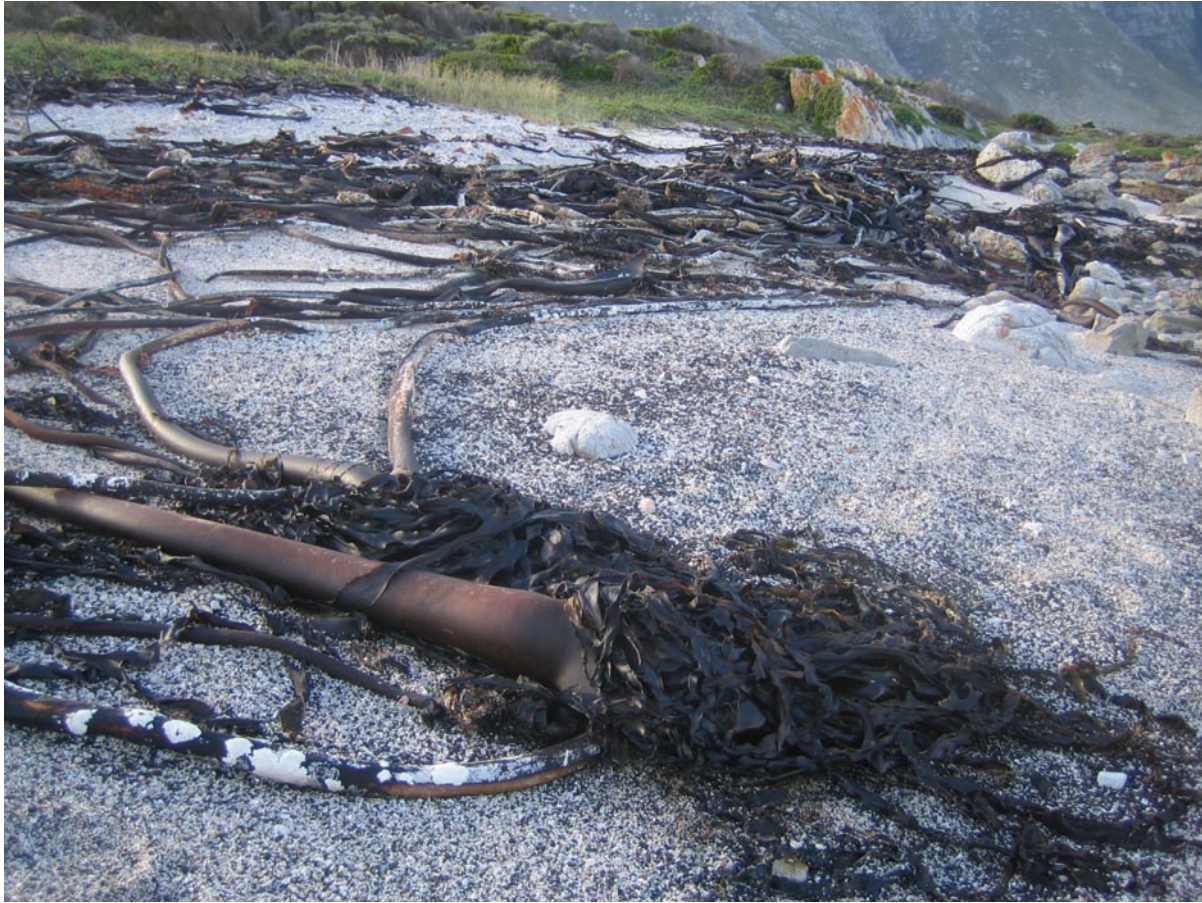
The widely distributed seaweed Ecklonia maxima , is commonly known as ‘seetrompet(-ter)’, which could well have been a Dutch version of the Portuguese common name ‘tromba’ or ‘trombas’ (plural). Photographed at Betty’s Bay, South Africa in 2010.

cultivated plants. The remaining names refer mostly to plants with well-known widespread uses. The Portuguese often used names of the plants of their own flora for local plants bearing a vague resemblance. For example, the name ‘malvas’ originally applied to plants of the genus Malva L. (which occurs naturally in Portugal) was used by the colonists for Abutilon mauritianum (Jacq.) Medik., a plant of the same family (Malvaceae). Interestingly, the Afrikaans common name ‘malva’ is consistently applied to species of Pelargonium L’Hér., the geraniums of the horticultural trade. Likewise, the name ‘alcaçuz’ commonly used in Portugal for Glycyrrhiza glabra L. (liquorice), a plant not recorded for Angola, is used as ‘alcaçuz-branco’ (white alcaçuz) or ‘alcaçuz-do-mato’ (alcaçuz from the bush) for Mondia whitei (Hook.f.) Skeels, an indigenous plant with roots that apparently taste like liquorice.