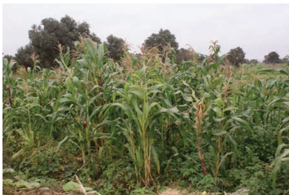
A field of maize ( Zea mays ) on the outskirts of the town of Namibe, Angola, in August 2010.

Gossweiler (1953) states that some of the names he recorded were no longer in use at the time of writing. In fact, the world of common names is not static, with new names continually being coined while others fall into disuse. Nevertheless, it is important to record them for purposes of locating them in the original sources. An interesting example of name changes and their importance in the study of plant introductions is that of the common names for Zea mays L. (maize).